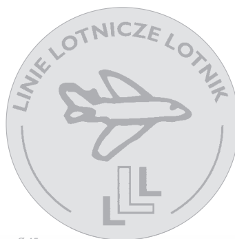
Ø 45 mm