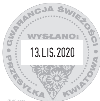
Ø 45 mm