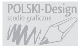
24 x 41 mm